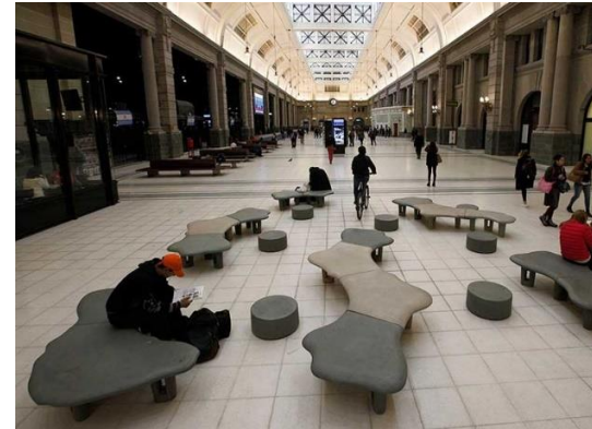
Imagen 1: Bancos “Encuentro” – Estudio Cabeza