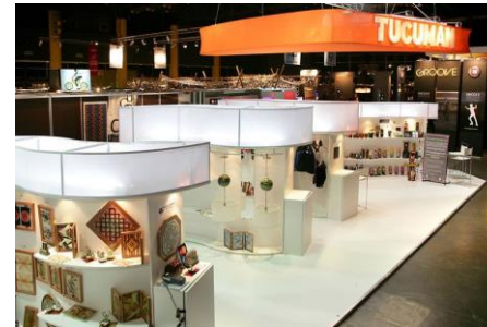
Imagen 6: Stand de Tucumán en Puro Diseño 2010 Diseñado por Jesús Jimenez y Alejandro Seiler