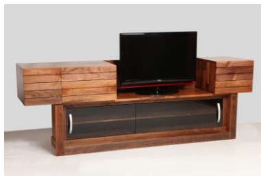
Imagen 5: Centro de entretenimientos Antó – Alejandra Rumich