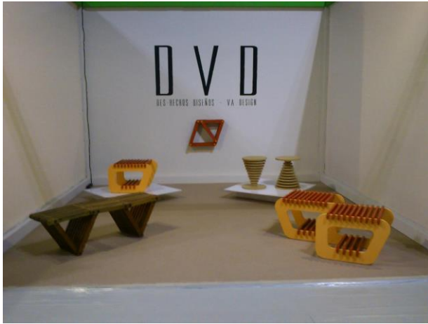
Imagen 9: Stand DVD-Salón Satellite-Milán-2013