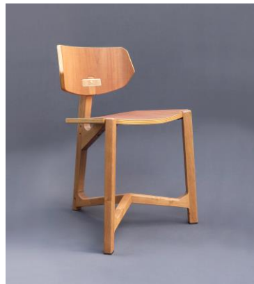
Imagen 10: Silla Ika-Ernesto Torreano