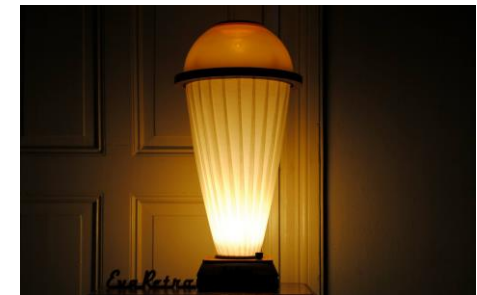
Imagen 7: Lámpara Eva Retro – Renzo Strada