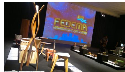
Imagen 8: Perchero Cedrón – Jorge Rivadeneira