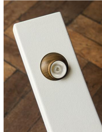
Imagen 11: Detalle lámpara Magra-Ernesto Torreano