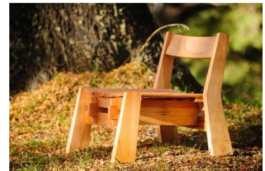
Imagen 12: Sillón Yuco armable-El Catango