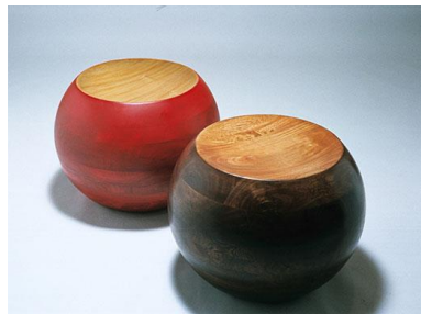
Imagen 4: Colección Carnavala – USOS