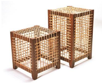
Imagen 3: Colección Atada – USOS